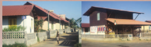
Logements neufs (Programme "SARAMACA")