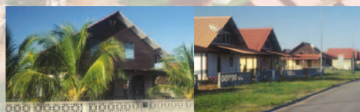
Logements neufs (Programme "SARAMACA")